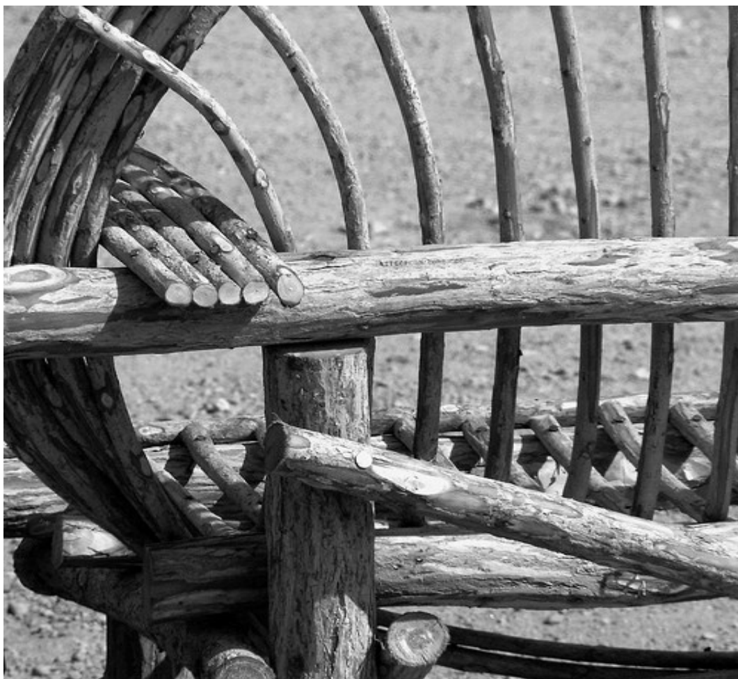
Wicker Composition